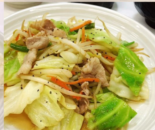
肉野菜炒め定食 640円