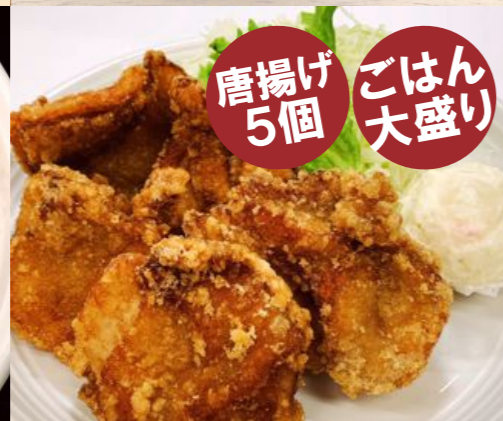
ガッツリとり唐揚げ定食 860円