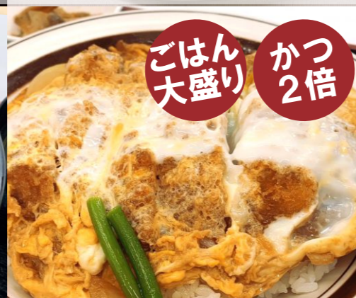
ガッツリロースかつ丼 820円