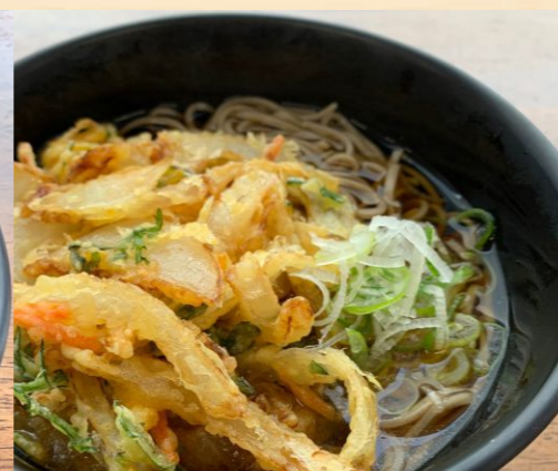
野菜かき揚げそば/うどん 530円