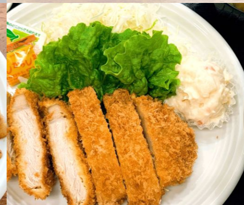
ロースとんかつ定食 780円