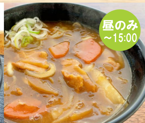
カレーうどん/そば 500円