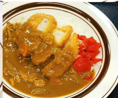
カツカレーライス 650円