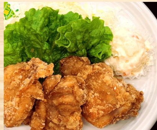
味自慢とり唐揚げ定食 640円