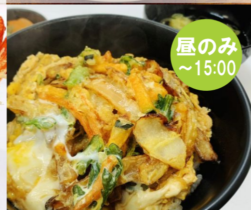
かき揚げ卵とじ丼 500円