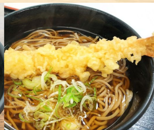
大海老天そば/うどん 600円