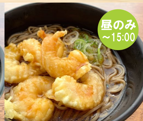
バラ海老天そば/うどん 580円