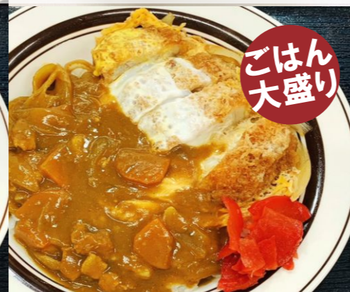
ガッツリかつ丼カレー 820円