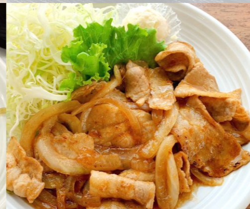
豚生姜焼き定食 750円