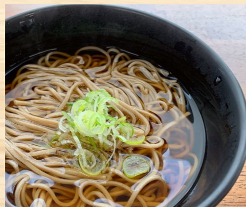
かけそば/うどん 330円